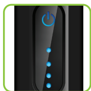
Indicadores luminosos LED